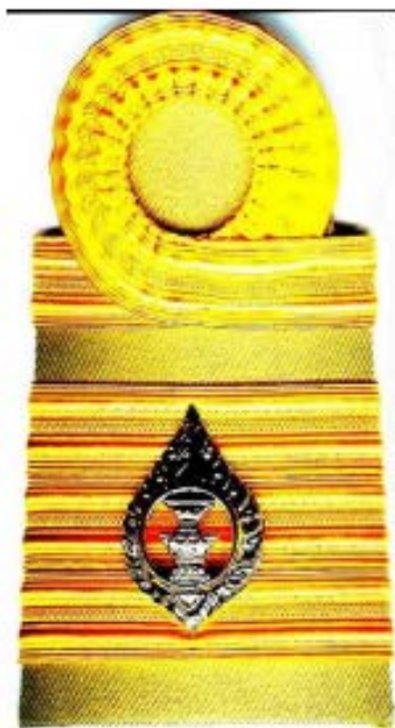
เครื่องแบบปฏิบัติราชการ (สีกากี)