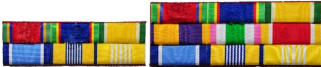
แพรแถบเหรียญที่ระลึก ๖ ชนิด