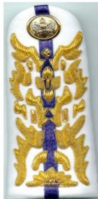
เครื่องแบบพิธีการ (ปกติขาว)