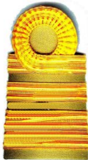
เครื่องแบบพิธีการ (ปกติขาว)